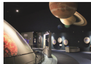
札幌市青少年科学館