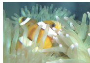
新さっぽろ サンピアザ水族館