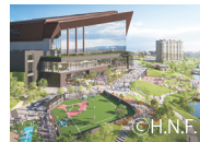
ES CON FIELD HOKKAIDO